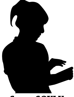
Serap SOYLU 10 TM-A

K elimeler, onlar "gerçeğin beceriksiz avcıları". Ve anlamlarını yitirdiklerinde artık herşey anlamını yitirmeye başlar. Kelimeler yeryüzündeki en anlamlı dağlar, denizler ve sıyrılıp gelirler insanoğlunun yorgun dudaklarından.