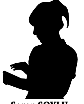
Serap SOYLU 10 TM-A

"mutluluktan ölüyorum". Kulaklarıma inanmamıştım. Bu acı ile haykıran ses mutluluktan ölüyordu. İnsan hiç mutlu olduğu için acı çeker miydi? Sesin sahibi gittikçe yaklaşıyor, bir nevi hüznümü kovalıyordu. Adımlar sıklaştı ve karşı kaldırımda durdu. Oturduğum köşenin en kuytu karanlıklarına gömüldüm. Bu mutlu yabancıyla sohbet etme niyetinde