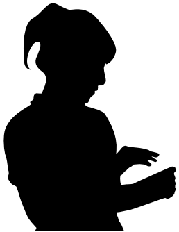
Hatice DAL 9 - B

Öyle acımasız oyunlar oynar ki! Bazen, beklenmedik bir anında tutuverir yakandan ağlarsın! Ne çare ki elinden tutacak kimse yok. Yalnızsın!